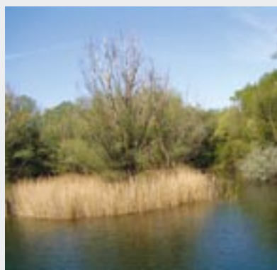
Himmelteich in der Niklas-Eslarn-Straße im 22. Bezirk. (ND 689)

Wie ein grüner Teppich liegt sie auf dem Plateau, umgeben von steil ansteigenden Hängen, die mit Flaumeichen und Kiefern bewachsen sind. Mittendrin stehen einige alte, große mächtige Bäume. Ihr Name hält, was er verspricht. Die Himmelwiese im 23. Bezirk (Naturdenkmal Nr. 536) ist eine der schönsten Wiesen Wiens. Vegetationskundlich betrachtet handelt es sich um einen Trockenrasen mit teilweise pannonischen Pflanzen, wie sie nur in Niederösterreich und dem Burgenland vorkommen. Pflanzen, die trockenen Boden lieben, finden hier ein Paradies. Frühlingsadonis, Kuhschelle,