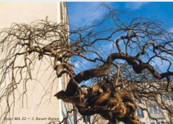
Trauerschnurbaum im 21. Bezirk, Pius-Parsch-Platz. (ND 792)

Trotz aller Bemühungen halten unsere Naturdenkmäler nicht ewig. Pro Jahr müssen einige wenige ganz oder teilweise widerrufen werden, da sie ihr Lebensende erreicht haben. Doch immer wieder entdecken auf­merksame WienerInnen bisher unbekannte Natur- und Baum­schönheiten, die dann als neue Naturdenkmäler geschützt werden.